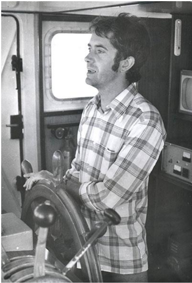
JP à la barre de l'Archéonaute dans sa jeunesse...