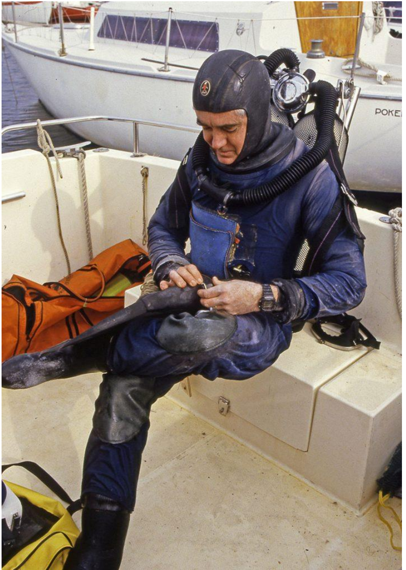
Une combinaison étanche « customisée »...